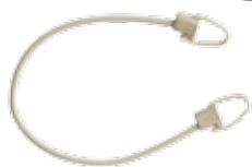
Sandowclick sable de sécurité