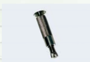
Piton douille Inox Alu

NOTA : Dans le cas de pitons douille présentant un léger jeu dans le dallage suite à un défaut de perçage, il est indispensable d'ovaliser la douille au moyen d'un marteau afin d'optimiser la tenue de celui-ci.