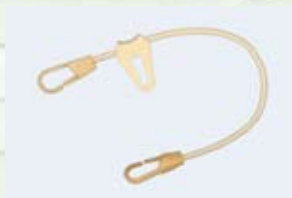
Sandowclick sable avec passant d'arrimage