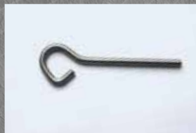
Piton «P» Inox de sécurité