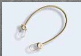
Sandowclick sable de sécurité